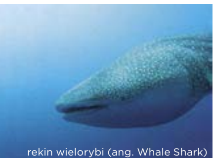
rekin wielorybi (ang. Whale Shark)

Wokół wyspy rozpościera się przepiękna rafa, łagodnie opadająca do głębokości 30m. W zależności od miejsca, które zostanie wybrane do nurkowania trafimy na bujne ogrody koralowe ciągnące się płasko na głębokości ok. 20m, lub skupiska wyrastających z piaszczystego dna bloków skalnych. Wszędzie jednak towarzyszyć nam będzie bardzo bogate życie