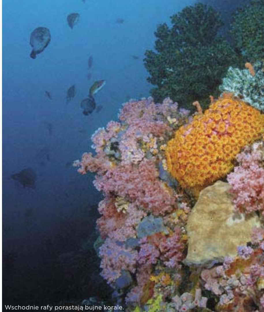
Wschodnie rafy porastają bujne koralce.