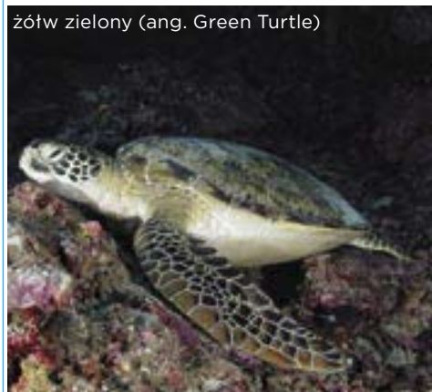
żółw zielony (ang. Green Turtle)

Powyższa lista to najbardziej znane i cenione lokalizacje. Na Similanach znajduje się prawie 30 różnych miejsc do nurkowania, a co roku adaptowane są nowe. Warto więc odwiedzić archipelag ponownie, chociażby po to, aby poznać jego najnowsze atrakcje.