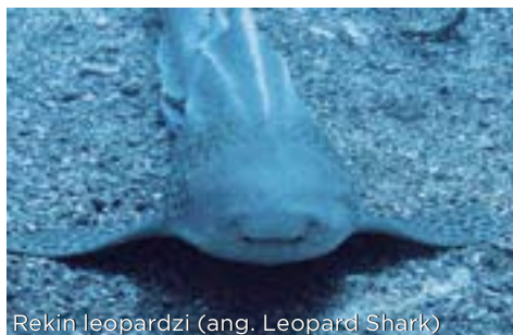
Rekin leopardzi (ang. Leopard Shark)

Purpurowa Skąta położona jest tuż obok Hin Daeng. Jej nazwa pochodzi od kolonii purpurowych miękkich koralu, które bujnie porastają ściany rafy. Z obu stron opadają one stromo do głębokości 70m i stanowią spektakularny i niepowtarzalny widok. Nie bez powodu Hin Muang uznawany jest za doskonałe miejsce dla każdego nurkującego. Przyglądając się z bliska życiu na rafie mamy szansę znaleźć tam ślimaki nagoskrzelne, koniki morskie i inne bezkręgowce. Z drugiej strony chyba największą atrakcją tego miejsca są spotkania z ogromnymi rekinami wielorybimi (ang. Whale Shark) i mantami (ang. Manta Ray), które przyplývają tu bardzo często.