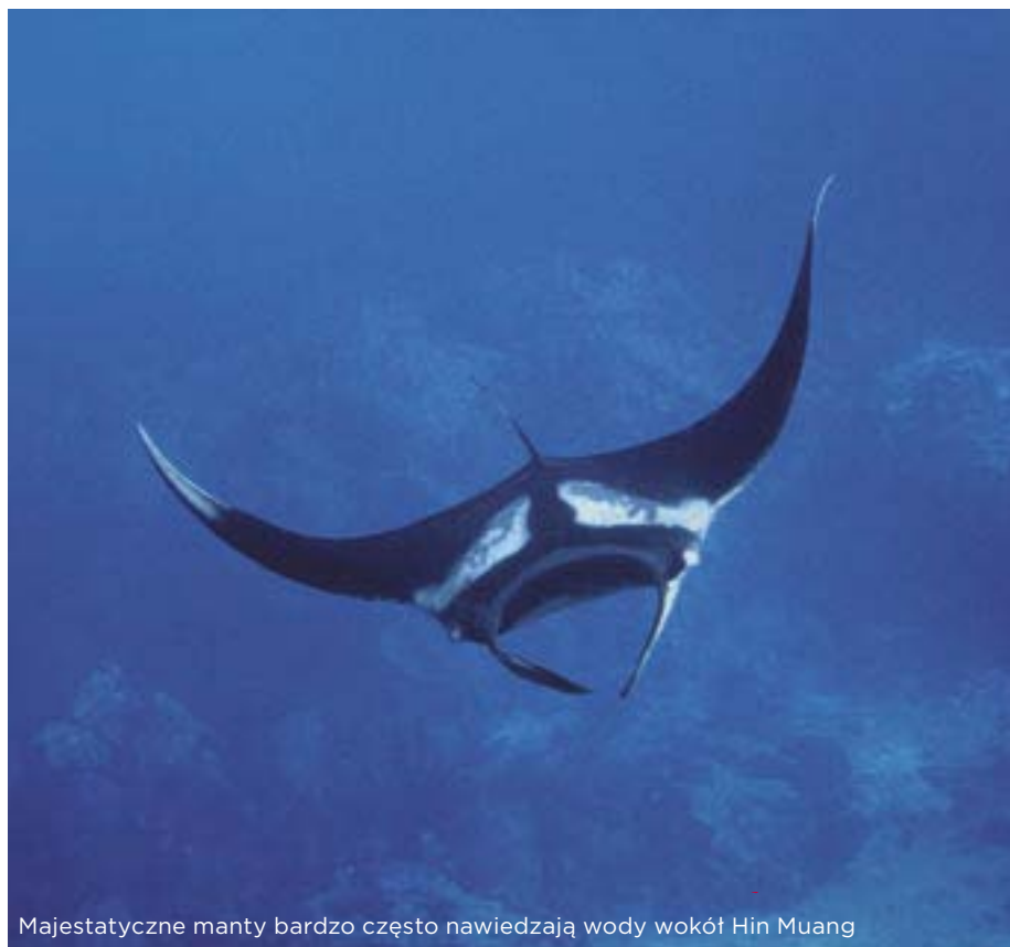
Majestatyczne manty bardzo często nawiedzają wody wokół Hin Muang